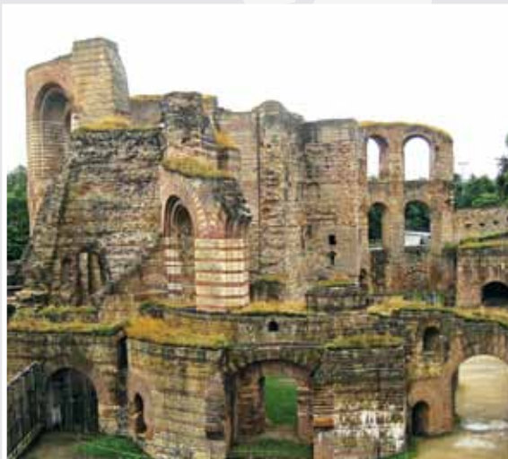
Kaisertherme in Trier

Dann solltest du überlegen, ob es nicht gut ist, LATEIN zu lernen. Denn im Lateinunterricht werden diese Fragen beantwortet und außerdem vieles andere. Dich erwartet eine phantastische Reise in die Welt der alten Römer – reich an interessanten Personen, ungewöhnlichen Schauplätzen und spannenden Abenteuern.